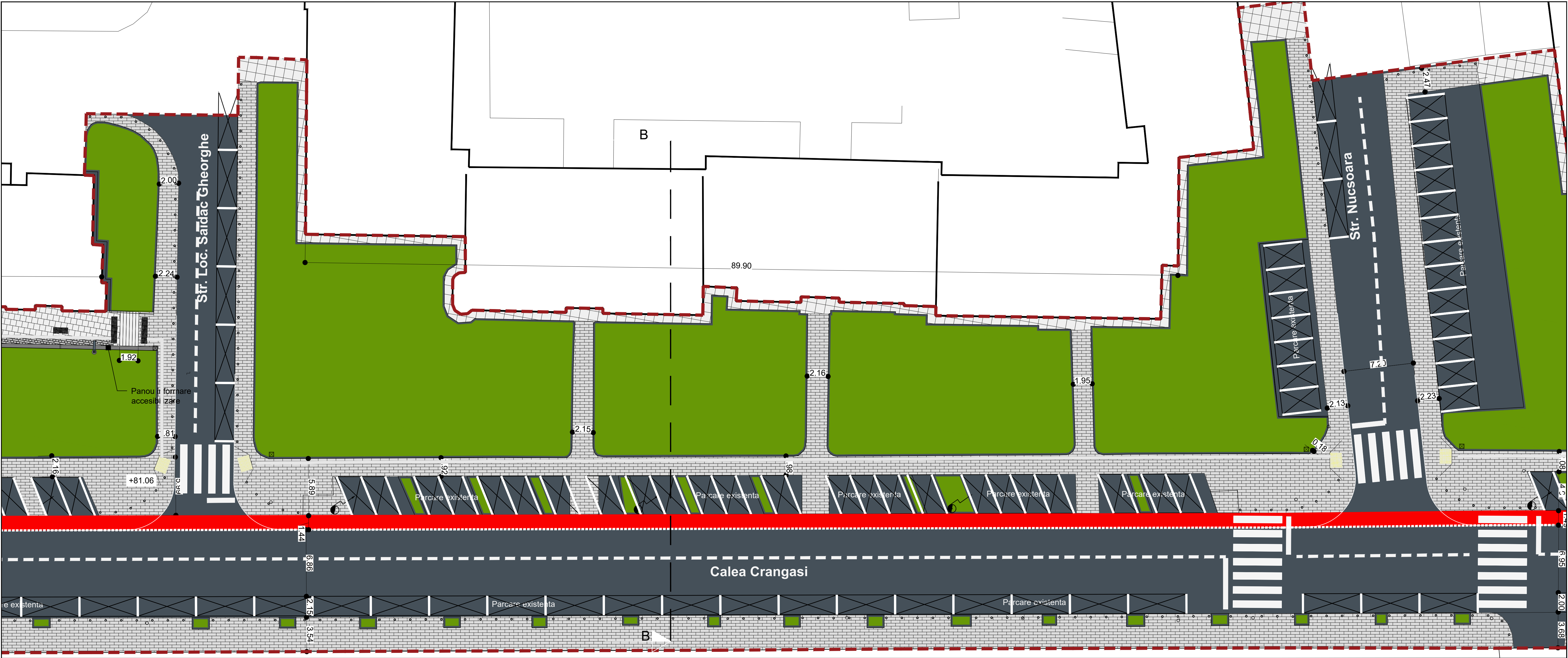
PLAN DE SITUAȚIE 1:200